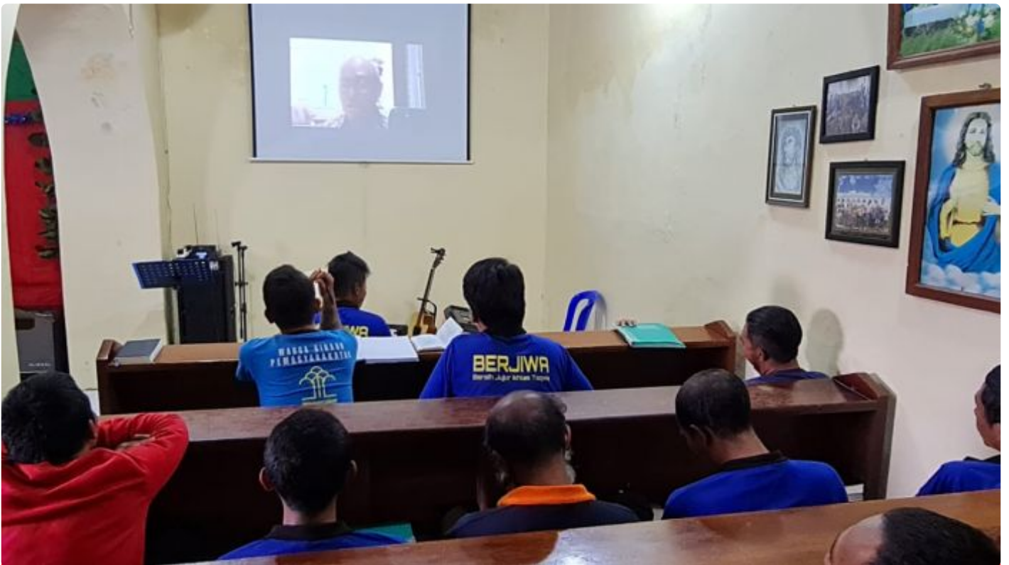
Kegiatan Ibadah WBP Umat Kristiani Lapas Ambarawa secara On Line

SEMARANG - Warga Binaan Pemasyarakatan (WBP) Lembaga Pemasyarakatan (Lapas) Ambarawa Mengikuti kegiatan ibadah virtual integrasi Lapas/Rutan se Indonesia, Rabu (02/11/2022).